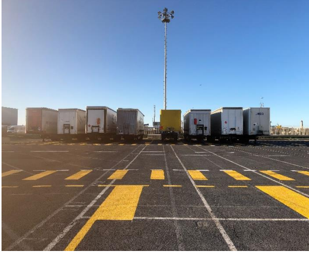
Treyler & Konteyner yanıcı terminali